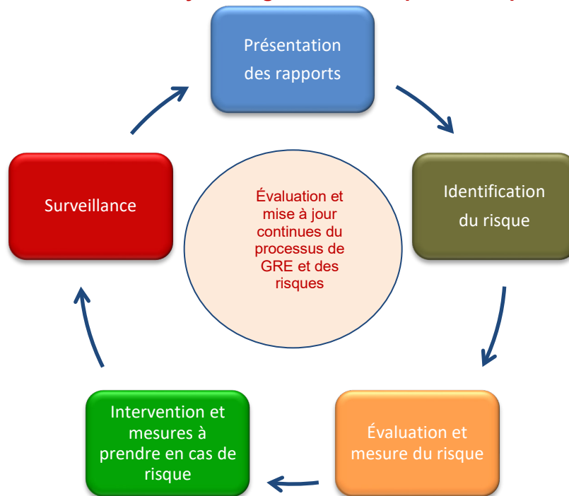
TABLEAU B : Cycle de gestion du risque d'entreprise

Le processus nécessite l'implication à tous les niveaux de la caisse; il exige la volonté de comprendre les risques auxquels fait face la caisse, d'aider à la création des réponses appropriées aux risques et de leur maintien dans des limites de propension et de tolérance au risque définies par le conseil d'administration et la haute direction.